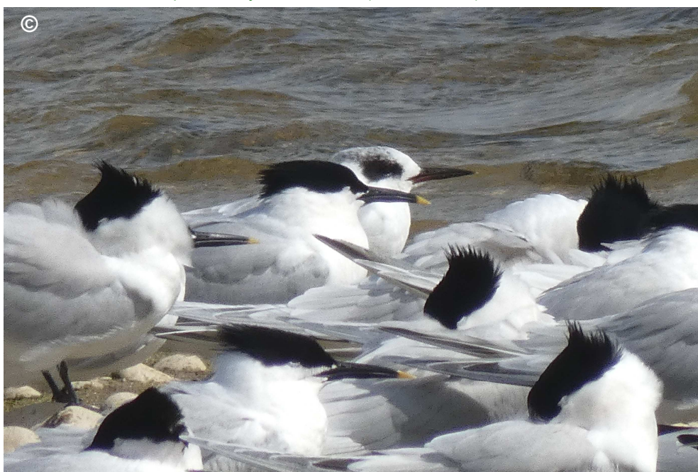
Photo 3 : Bas-champs de Cayeux-sur-mer (Somme - 80). 6 avril 2018.