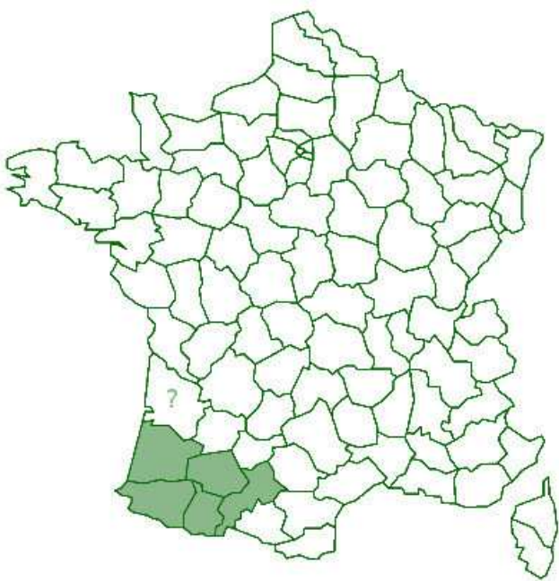
Carte 1 : répartition de l'espèce en France

Zeuneriana abbreviata est une Tettigonidae endémique d'Europe, citée uniquement en France et en Espagne, au sein du massif pyrénéen. En France, l'espèce n'est retrouvée, au sein de son aire de répartition naturelle, qu'en sud aquitaine et Pyrénées occidentales, dans les départements des Landes, des Pyrénées-Atlantiques, du Gers, des Hautes-Pyrénées et de la Haute-Garonne (Muséum national d'Histoire naturelle [Ed]. 2003-2017).