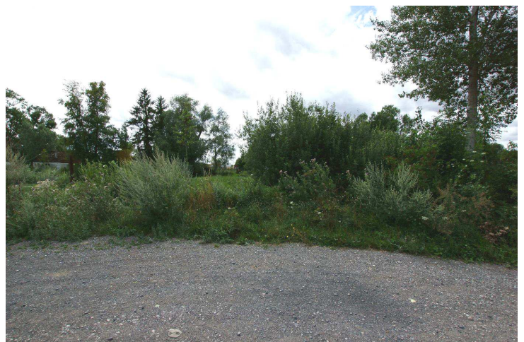
Photo 5 : Une des stations de collecte et d'observation de Zeuneriana abbreviata

Tous les individus trouvés dans la Somme, l'ont été au sein de végétations de mégaphorbiaie (Reine des prés, Eupatoire chanvrine...) ou de lisières nitrophiles (Ortie dioïque, Gaillet gratteron...). Des individus ont aussi bien été notés en bordure de prairie (au sein de la végétation de graminées) qu'au niveau d'une peupleraie ou au sein de la mégaphorbiaie bordant le canal de la Somme. Dans tous les cas, les observations ont été menées dans un contexte de zone humide.