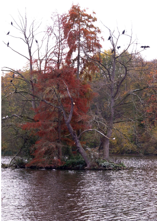
Photo 1 : Dortoir de Grands Cormorans sur les arbres d'un îlot des étangs de Commelles - Novembre 2017

Orry-la-Ville : 3 le 12 janvier (C. WALBECQUE). Dortoir sur un arbre d'un îlot des étangs de Commelles.