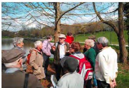
Sortie découverte au parc St Pierre