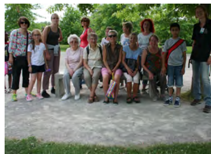
Promenade pédagogique aux étangs de Camon