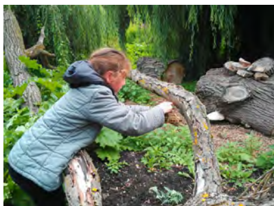
Installation des gîtes au Jardin des Vertueux