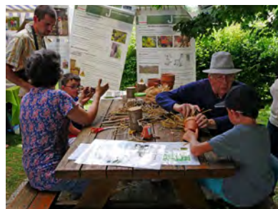
Stand fabrication de gîte à insectes