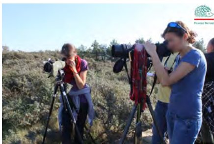
Formation et intégration au groupe Mammifères marins