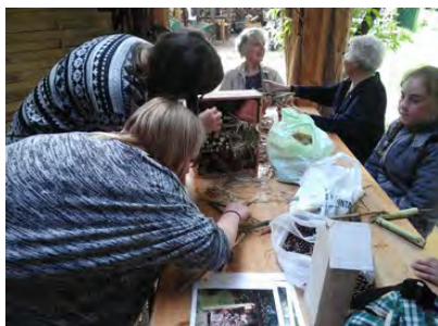
Atelier de fabrication gîtes à insectes

50 enfants ont participé à l'atelier mené lors de la manifestation JIJA.