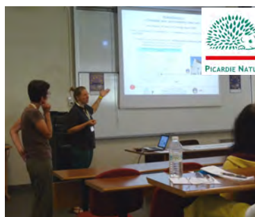
Journée Refuge pour les Chauves-souris à L'institut Charles Quentin