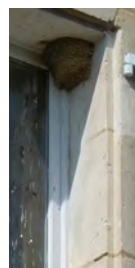
Nids posant problème en raison des fientes