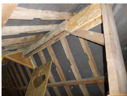
Grenier aménagé