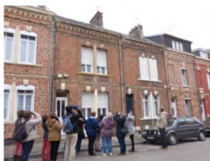
Session théorique et pratique « Recenser les nids d'hirondelles pour les préserver » (S.Dediercq)