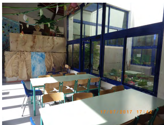
Découverte d'une chauve-souris égarée dans une école Il s'agit en réalité d'un gîte de plusieurs individus du genre notule ! C'est la première fois que ceci est observé en Picardie