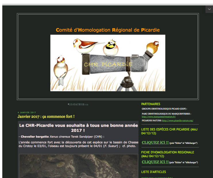
FIGURE 1 – Blog du CHR-Picardie.

La liste des espèces CHR mise à jour, la fiche vierge à remplir et les derniers rapports sont téléchargeables sur la page d'accueil du blog du CHR Picardie : http://chr-picardie.over-blog.com/ .