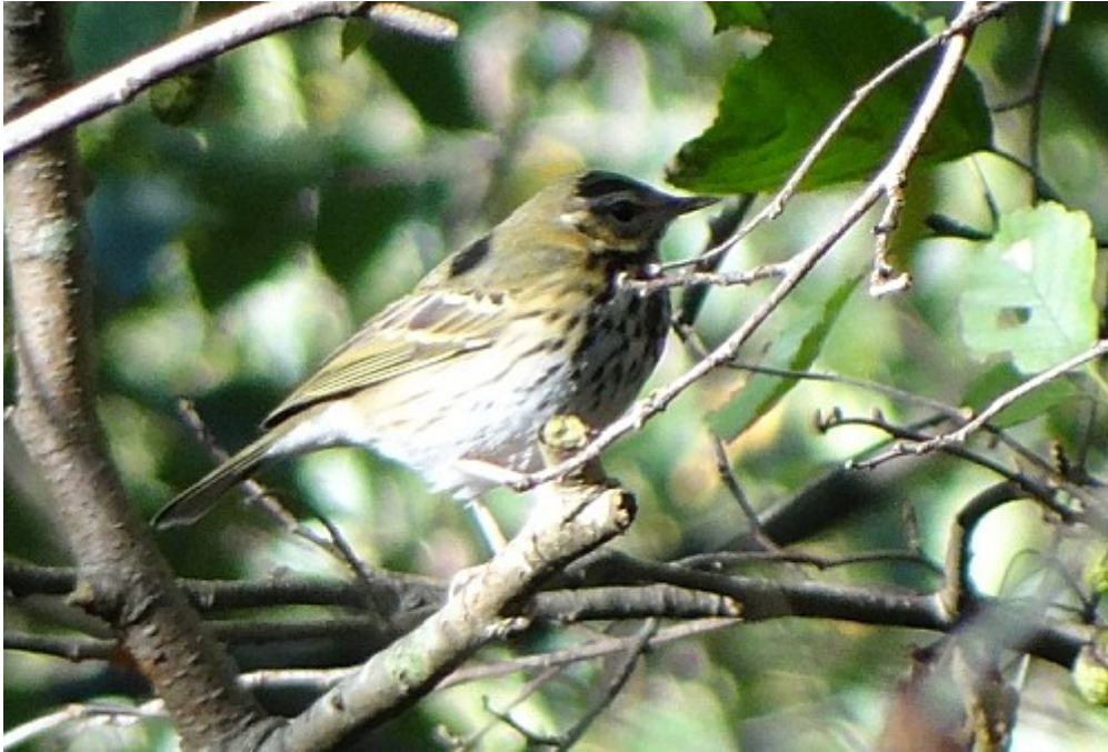
FIGURE 1 – Pipit à dos olive - Saint-Quentin-en-Tourmont-80 - octobre 2011

LPO Oise, Picardie Nature, le Comité d'Homologation National (CHN) et le Parc Ornithologique du Marquenterre. Nous remercions également ce dernier de nous avoir accueilli dans ses locaux à l'occasion de réunions du groupe.