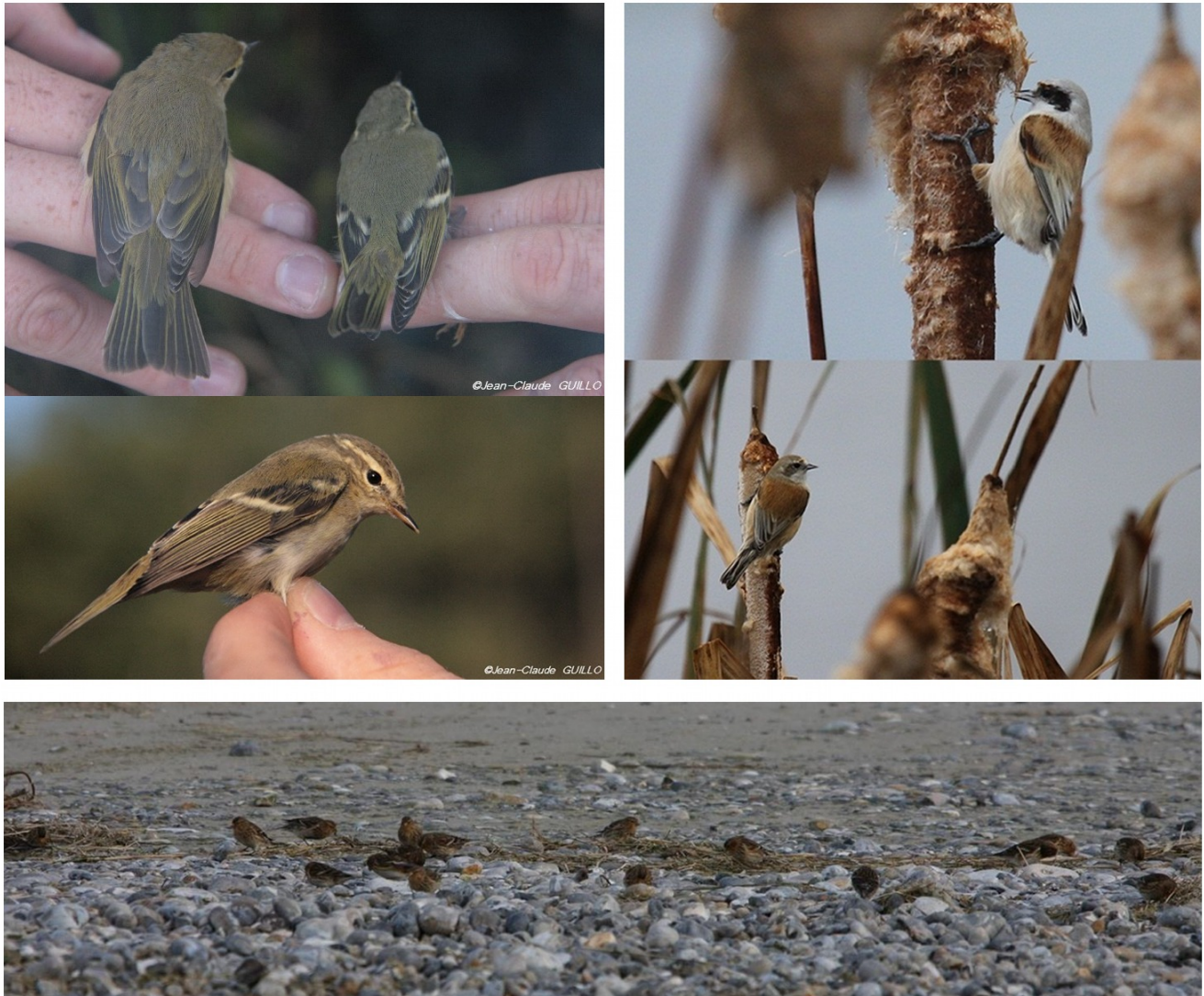
FIGURE 6 – En haut à gauche : Pouillot à grands sourcils avec un Pouillot véloce - Saint-Quentin-en-Tourmont - octobre 2011 ; en haut à droite : Rémiz penduline - Le Crotoy - novembre 2011 ; en bas : Linotte à bec jaune - Cayeux-sur-Mer-80 - janvier 2011