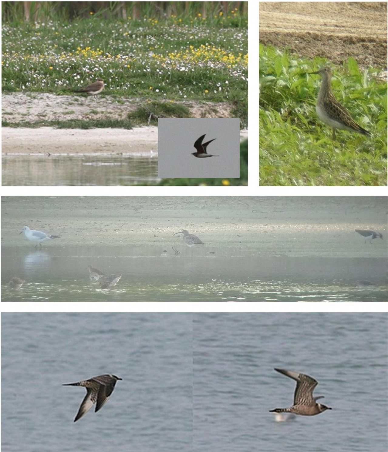
FIGURE 4 – En haut à gauche : Glaréole à collier - Cayeux-sur-Mer-80 - mai 2011 - photo P. Dufour ; en haut à droite : Bécasseau tacheté - Chevrières-60 - septembre 2011 - photo Y. Dubois ; au milieu : Courlis corlieu - Chevrières-60 - avril 2011 - T. Daumal ; en bas : Labbe à longue queue - Cayeux-sur-Mer-80 - novembre 2011 - photo P. Dufour