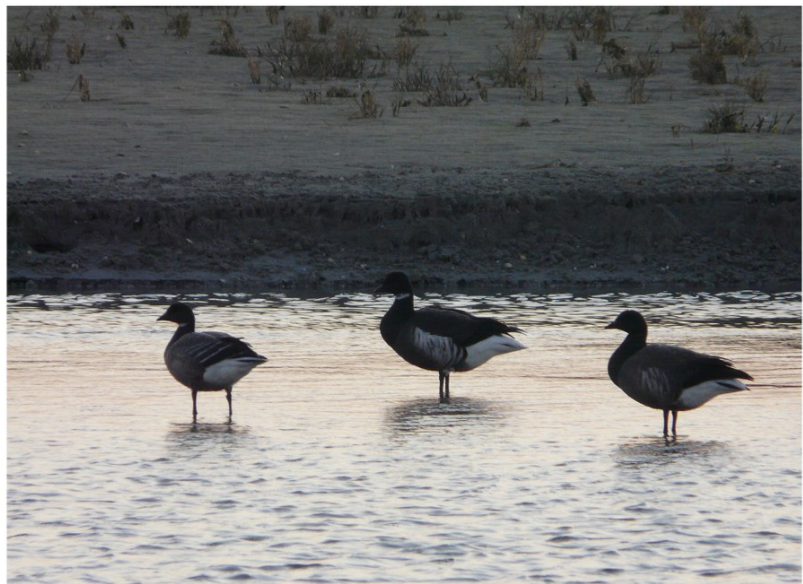
FIGURE 2 – En haut à gauche : Cygne de Bewick - Origny-Sainte-Benoîte-02 - mai 2011 ; en haut à droite : Cygne chanteur - Saint-Quentin-02 - janvier 2011 ; au milieu : Oie rieuse - Limé-02 - décembre 2011 ; en bas à gauche : Crabier chevelu - Rivecourt-60 - juin 2011 ; en bas à droite : Bernache du Pacifique - Saint-Quentin-en-Tourmont-80 - décembre 2011