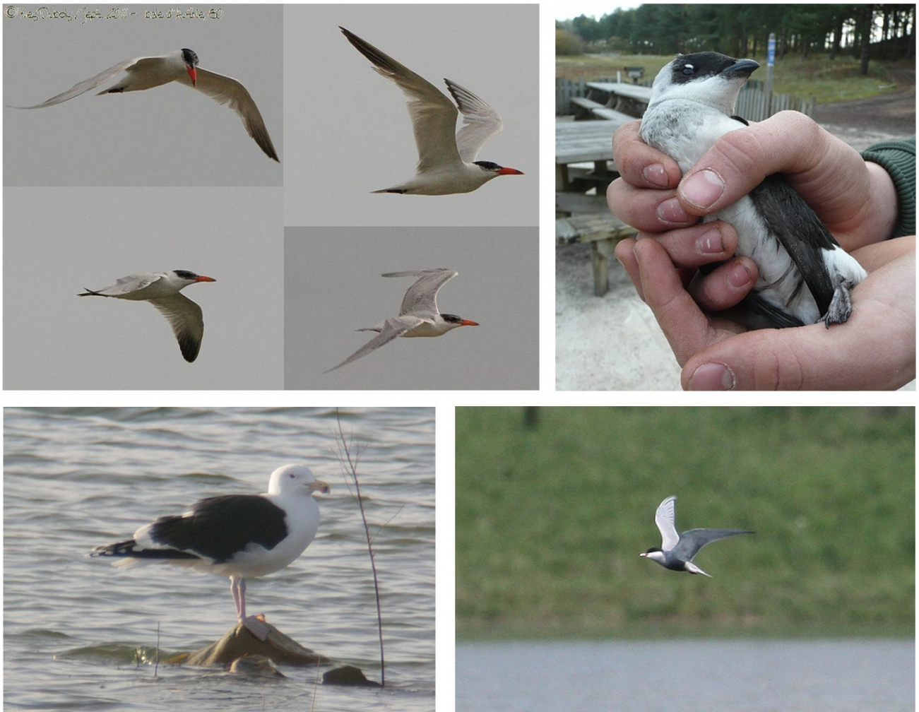
FIGURE 5 – En haut à gauche : Sterne caspienne - Baie d'Authie-80 - septembre 2011 - photo Y. Dubois ; en haut à droite : Mergule nain - Saint-Quentin-en-Tourmont - décembre 2011 - photo POM ; en bas à gauche : Goéland marin - Rivecourt-60 - mars 2011 - photo Y. Dubois ; en bas à droite : Guifette moustac - Limé-02 - avril 2011 - photo R. Le Courtois Nivart