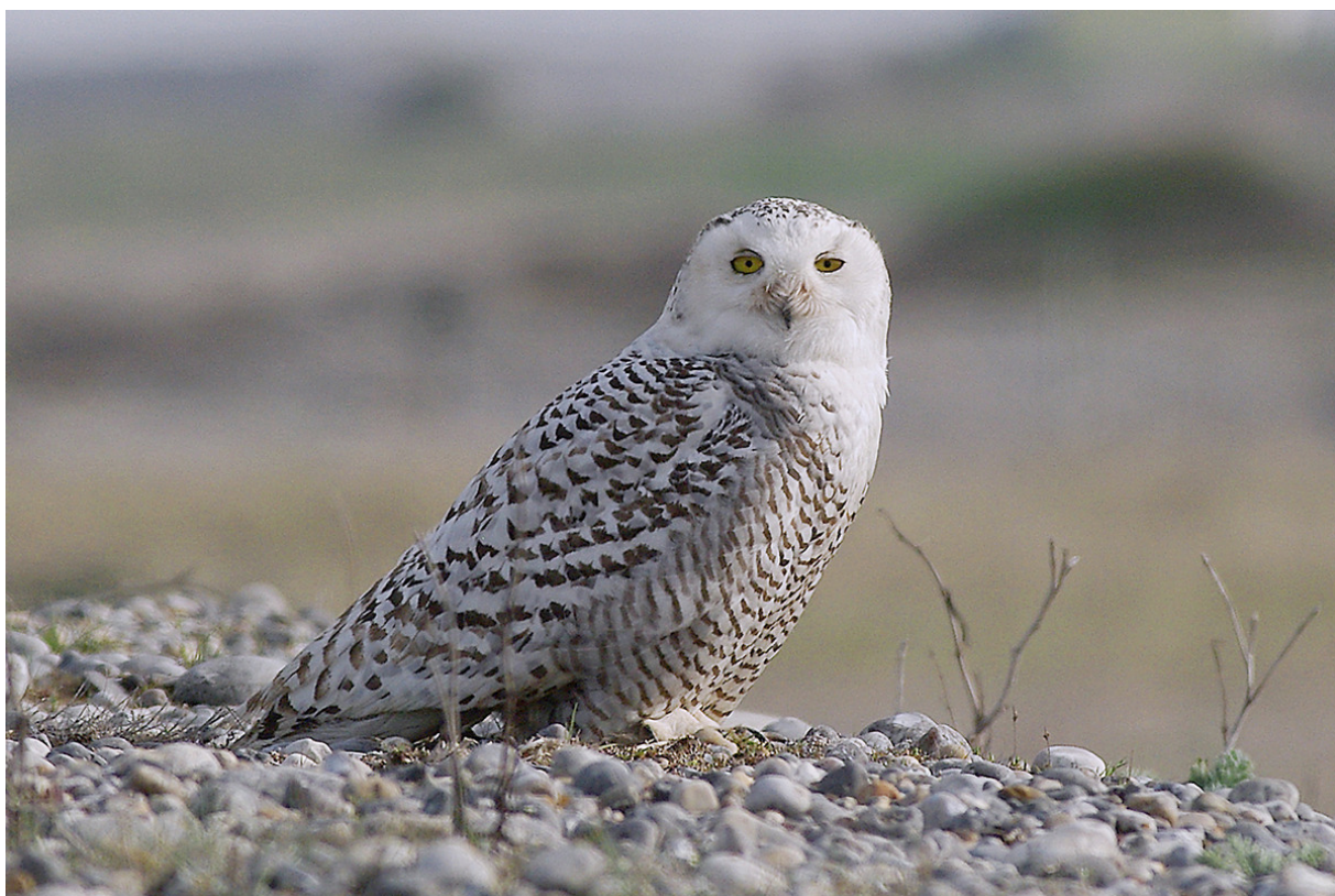
FIGURE 1 – Harfang des neiges - Cayeux-sur-Mer-80 - avril 2010