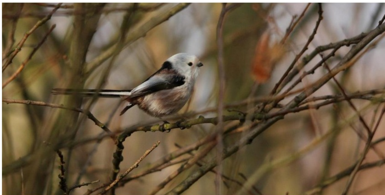
FIGURE 4 – En haut à gauche : Pluvier guignard - Attilly-02 - septembre 2009 - photo A.Mauss ; en haut à droite : Phalarope à bec étroit - Châtillon-sur-Oise-02 - août 2009 - photo A.Mauss ; en bas : Mésange à longue queue caudatus - Verberie-02 - décembre 2010 - photo Y.Dubois