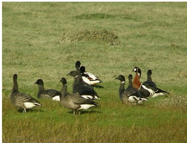
FIGURE 2 – En haut à gauche : Plongeon catmarin - Boran-sur-Oise-60 - décembre 2008 - photo Y.Dubois ; en haut à droite : Plongeon imbrin - Rivecourt-60 - décembre 2009 - photo Y.Dubois ; au milieu à gauche : Fuligule à bec cerclé - Verberie-60 - novembre 2009 - photo T.Daumal ; au milieu à droite : Grèbe jougris - Brissay-Choigny-02 - mars 2009 - photo A.Mauss ; en bas à gauche : Sternes arctiques - La Fère-02 - avril 2009 - photos A.Mauss ; en bas à droite : Bernache à cou roux - Saint-Valéry-sur-Somme-80 - décembre 2010 - photo Y.Dubois