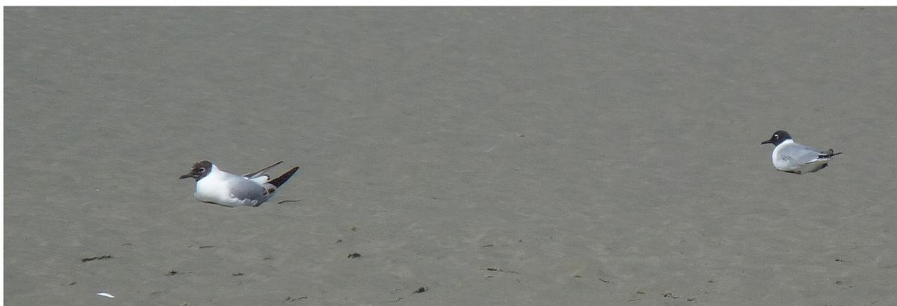
FIGURE 3 – En haut à gauche : Goéland bourgmestre - Holnon-02 - janvier 2008 - photo A.Mauss ; en haut à droite : Vanneau sociable - Deuillet-02 - mars 2010 - photo A.Mauss ; au milieu à gauche : Pélican blanc - Ault-80 - avril 2010 - photo T.Rigaux ; au milieu à droite : Goéland à bec cerclé - Holnon-02 - mars 2009 - photo A.Mauss ; en bas : Mouette de Bonaparte (oiseau de droite) - Cayeux-sur-Mer - avril 2010 - photo T.Rigaux