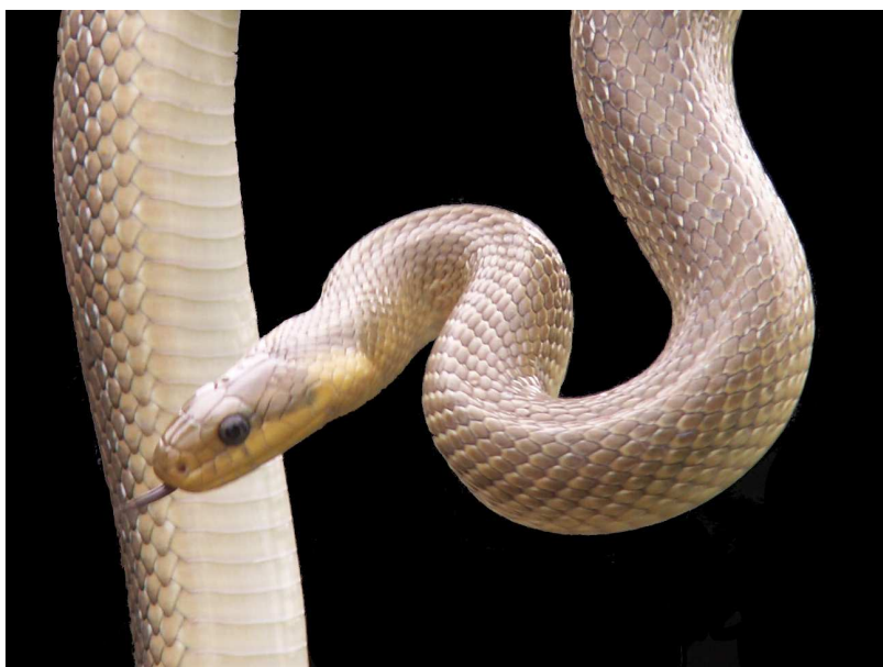
Photo. 3 : Couleuvre d'Esculape Zamenis longissima adulte photographiée à Noce (61).

La pose de plaques semble donc rester de loin la meilleure technique pour observer et étudier cette espèce. GUILLER (2009) n'a guère obtenu que 2% de ses données autrement. Les tôles ondulées en métal ou fibrociment sont efficaces, de même que les plaques en caoutchouc (par exemple les anciennes bandes de roulement de carrière).