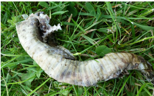
photo 2 : serpent trouvé à Vendières (02) le 23 juin 2012. Notez les écailles aux bords blancs.

Je me suis joint à l'équipe (S. DECLERCQ, A. DELAVAL, Y. DUQUEF, X., L. ET L. CUCHERAT) prospectant la zone de la vallée du Petit Morin car la Couleuvre d'Esculape y avait été découverte récemment, mais côté Seine-et-Marne (G. HALLART, com. pers.). Les conditions météorologiques n'étaient pas les plus propices à la recherche de serpents (les chaleurs de juin), mais un phénomène allait nous être favorable (bien qu'il ne le soit pas du tout pour le serpent lui-même) : la fauche des prairies.