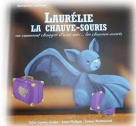
Figure 10: "Laurélie la chauve-souris" de C.Lamour-Crochet & al (A.Delaval)

Comme suggéré par Céline Fiquet, Guide Naturaliste au Parc du Marquenterre en 2011, un atelier pédagogique adapté aux scolaires peut être mis en place (pêle-mêle, jeu lié à l'écholocation, régime alimentaire, chasse, rythme de vie ...), d'autant plus que le Parc possède déjà la mallette pédagogique « Les chauves-souris vous sourient » de la fédération Connaitre et Protéger la Nature (CPN). Des outils pédagogiques relatifs aux chauves-souris existent comme par exemple ce livre destinés aux enfants de petite section (à partir de 3ans). De quoi sensibiliser dès le plus jeune âge que ce soit au Parc ou le cadre d'ateliers multiples au sein d'intervention dans les écoles du Grand Site.