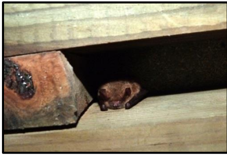
Figure 4: Murin à oreilles échancrées (29/06/2013) (A.Delaval)

Les prospections effectuées dans les postes d'observation la journée ont révélé la présence d'individus isolés de Murin à Oreilles échancrées dans les charpentes (plus précisément entre les chevrons). Quatre individus ont été observés au maximum dans les postes le 02 juillet 2013. Une Pipistrelle faisant penser à une Pipistrelle de Nathusius ( Pipistrellus nathusii ) a également été observée, posée sur une contre-fiche du poste 8 le 29 août 2013