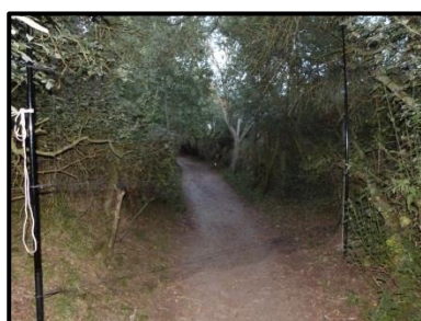
Figure 7: Filet au sol placé dans le lieu de passage supposé des chauves-souris

En 2013, Thomas Cheyrezy (Formateur à la pratique de la capture), Lucie Dutour (Animatrice de la déclinaison régionale du plan d'action) et Gratien Testud (Coordinateur régional) ont lancé la formation à la pratique de la capture en Picardie. Le 22 août 2013, une session de capture a été intégrée à cette formation régionale. En aucun cas une séance de capture de chauves-souris ne doit être un outil à la pédagogie. Au parc du Marquenterre, la capture se révélait essentielle afin de connaître les états sexuels des individus : indications quant à la présence éventuelle d'une colonie à proximité ou au sein du Parc. En présence de Philippe Carruette (Responsable pédagogique) et Grégory Rollion (Garde de la Réserve Naturelle), six filets ont été posés et trois espèces ont été capturées puis identifiées : 12 Pipistrelles communes, une Pipistrelle de Nathusius et un Murin à oreilles échancrées, soit un total de 14 individus. La présence de P.Carquette, bagueur du Muséum National d'Histoire Naturelle a également permis de baguer une jeune femelle d'Epervier et un Merle noir en début de soirée.