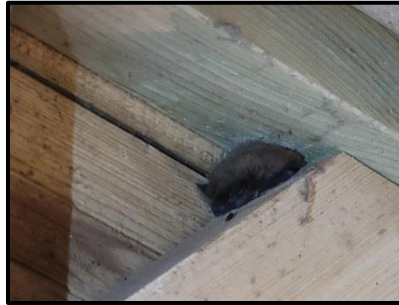
Figure 5: Pipistrelle posée dans le poste 8 (29/08/2013) (A.Caulier)