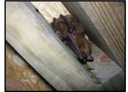
Figure 6: Trois Murins à oreilles échancrées (22/09/2013) (Y.Dubois)