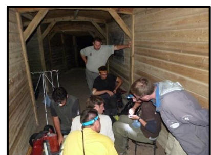
Figure 8: Poste de capture (A.Delaval)