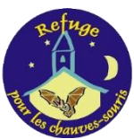
Figure 11: Logo de l'opération "Refuge pour les chauves-souris"