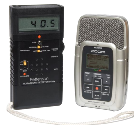
Figure 2: Détecteur Pettersson D240x et enregistreur

Le prix des détecteurs d'ultrasons varie entre 75€ et 5000€, les modèles sont divers. L'utilisation d'un détecteur manuel permet un inventaire mobile. Plusieurs types de milieux (boisements, prairies, lisières...) peuvent être inventoriés dans une même nuit d'écoute. Directement sur le terrain, l'utilisateur peut également étudier le comportement des individus dans leurs milieux. Le Pettersson D240x est le modèle de détecteur manuel le plus connu (devis présenté en Annexe 1). Ce matériel possède diverses fonctions permettant les analyses ultérieures nécessaires à l'identification des espèces. En effet, le « direct » (appelé « hétérodyne ») ne permet pas de déterminer l'espèce. La fréquence, le rythme et l'intensité permettent cependant d'orienter la détermination et d'en déterminer le genre (ex : Myotis sp). Il donc nécessaire d'enregistrer le son et de l'analyser sous informatique grâce au mode « expansion de temps » : le son est ainsi ralenti 10 fois. L'achat d'un enregistreur (exemple de marque Zoom) s'avère donc obligatoire (devis présenté en Annexe 1).