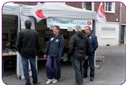
Forum des associations d'Amiens Métropole AGORA, Amiens, édition 2013

De nombreuses manifestations sur l'environnement, la nature et bien d'autres sujets se déroulent en Picardie chaque année. Picardie Nature est régulièrement invitée à participer à certains événements : l'association peut y répondre favorablement grâce aux nombreux bénévoles qui se relayent. UN GRAND MERCI A VOUS.