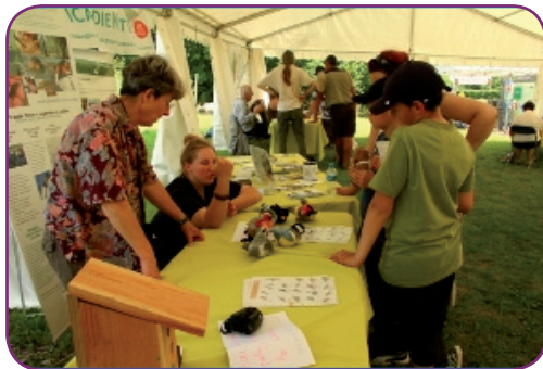
Festivère, Beauvais, édition 2013

27 événements ont donc été assurés, soit 10 de plus par rapport à 2012, représentant 33 journées au total.