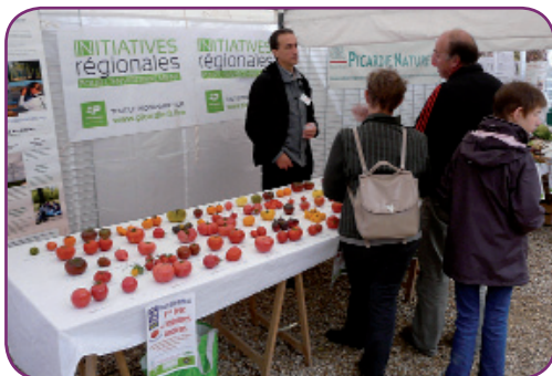
Fête des Légumes anciens, Rocourt-Saint-Martin, édition 2013