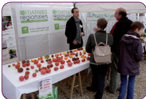
Fête des Légumes anciens, Rocourt-Saint-Martin, édition 2013