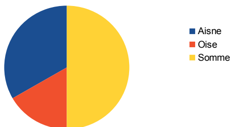
Répartition des signalements "Sentinelle de l'environnement" par département

A noter que les retours d'information des services de l'État peuvent être parfois longs le temps de l'instruction d'un PV. Bien généralement nous avons un retour sur l'établissement d'un PV l'année suivante du signalement le temps de l'instruction.