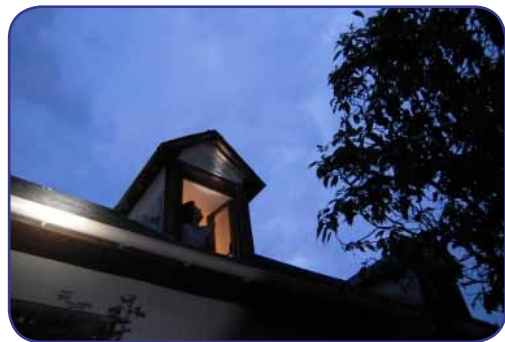
Intervention «SOS Chauves-souris».

Ce document présente les principales espèces que l'on trouve dans notre bâti, leur mode de vie (régime alimentaire, habitat et territoire de chasse, prédateurs, menaces, cycle annuel, ...), ainsi que des aménagements à faire chez soi (dans la cave, le grenier, le jardin, ...) pour aider ces mammifères volants.