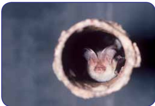
Oreillard roux

En 2012, Picardie Nature décline le label national «Refuge pour les Chauves-souris». Il permet de mettre en avant les actions des particuliers et des collectivités pour les chauves-souris. Picardie Nature réalise un diagnostic et apporte conseils adéquats. Aux 4 refuges picards en 2012, s'ajoutent déjà 21 refuges cette année, et d'autres sont à venir.