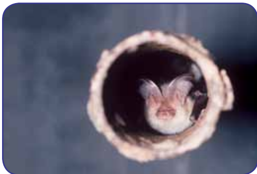
Oreillard roux

En 2012, Picardie Nature décline le label national «Refuge pour les Chauves-souris». Il permet de mettre en avant les actions des particuliers et des collectivités pour les chauves-souris. Picardie Nature réalise un diagnostic et apporte conseils adéquats. Aux 4 refuges picards en 2012, s'ajoutent déjà 21 refuges cette année, et d'autres sont à venir.