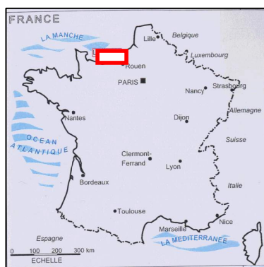
Figure 1 : Localisation du site.

Protection de la Nature) le 21 février 2001 et a reçu l'agrément de la Ministre de l'Aménagement du Territoire et de l'Environnement le 21 mai 2001.