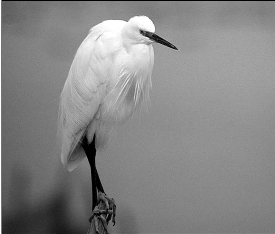
Aigrette garzette