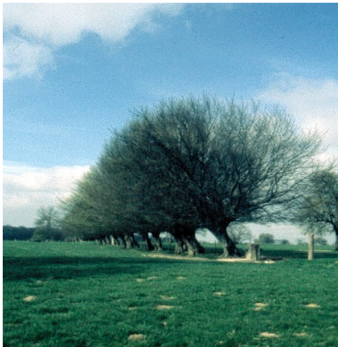
(Haie coupe-vent au Coudray-St-Germer)