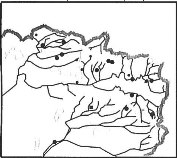
Fig.5 : Localisation des Vanneaux huppés nicheurs

Estimations de 50 à 70 couples pour la Thiérache*, 70 à 100 pour le département de l'Aisne * et de 250 pour la Picardie (1995) ***.