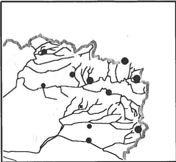
Fig.3 : Localisation des Faucons hobereaux nicheurs