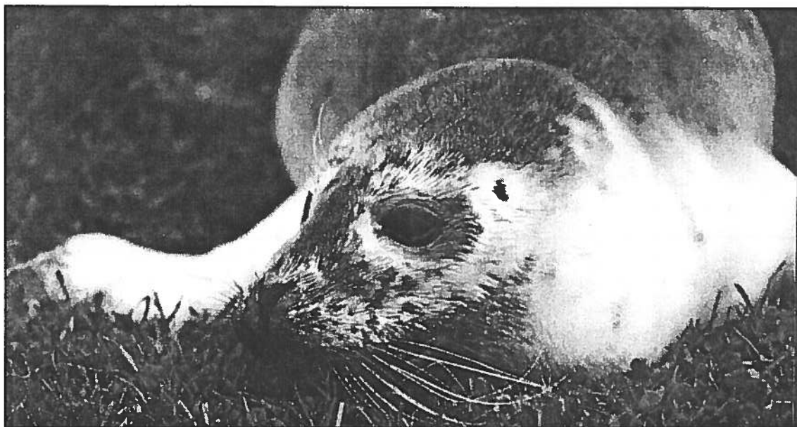
«Eclipse» : bébé phoque de 2 semaines trouvé le 12/08 et relâché le 22/11 au Pays-Bas.

par Radio France Picardie, France Inter, France 3 Picardie.