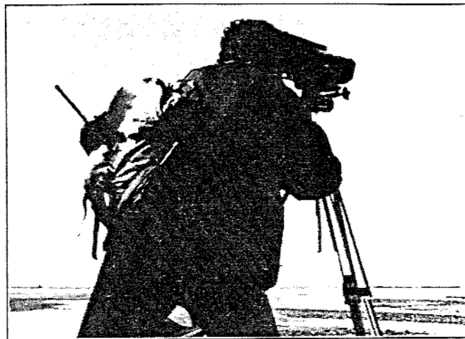
Après, en Baie de Somme

Quelques promeneurs ayant aperçu les deux compères, nous demandent de quoi il s'agit. Après un coup d'oeil dans la binoculaire et quelques exclamations «Whhaaahh ! Pas possible ! Regarde Alain ! Ohh wouais...! C'est génial ! » viennent les questions importantes.