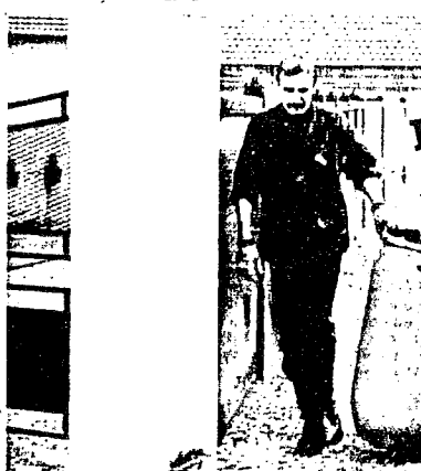
Les pompiers de CMIC ont isolé le colis qui contenait la bonbonne de bromopyridine.

Les déchets envahissent vraiment notre quotidien. Les déchets ménagers dont on ne sait plus quoi faire quand les décharges débordent, les déchets industriels que l'on retrouve dans des fûts sans étiquette là où ils ne devraient pas être stockés.