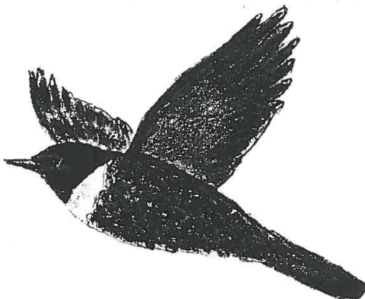
Dessin Marc Sengez

YEATMAN L. (1976) Atlas des oiseaux nicheurs de France. Paris, S.O.F., 282 p